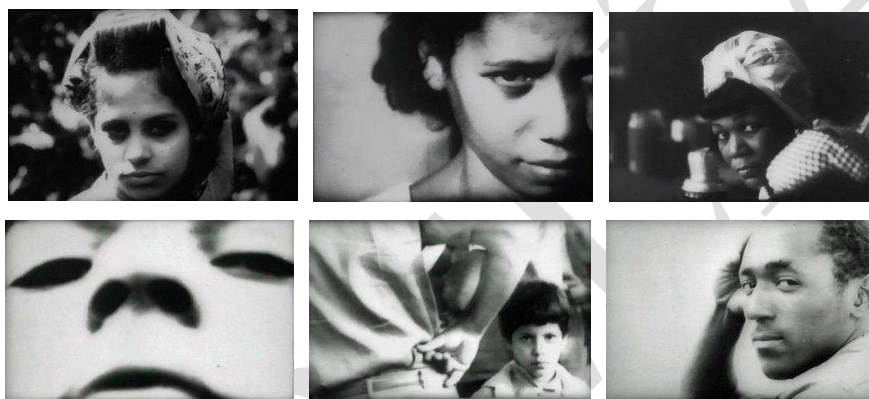
Figura 3. Ejemplos de ruptura de la cuarta pared en Coffea Arábica (algunos procedentes de los documentales censurados de su Trilogía Rural).

la histeria política colectiva, evocan por un momento la placidez de Ociel del Toa y otros cortometrajes de su filmografía temprana. Pero un nuevo cartel exige «más producción» y un montaje rápido repite la dinámica del cortometraje hasta ese momento: explicación didáctica de los últimos pasos en el tratamiento de los granos del café y su consumo en los bares y calles de La Habana. En algunas de las escenas rodadas en una de las fábricas sorprende el choque entre la estética futurista propia del cine Vertov, que se deriva de la repetición constante de imágenes de máquinas trabajando a pleno rendimiento y primerísimos planos en contrapicado de rostros de trabajadores, y las composiciones estáticas un grupos de otros posando ante la cámara. Todas estas rupturas de la cuarta pared, tan habituales en la cinematografía de Guillén Landrián, apuntan a la búsqueda de la implicación del espectador, como vía de escape a la disolución del Yo en lo colectivo, algo impensable en los documentales épico-doctrinarios.