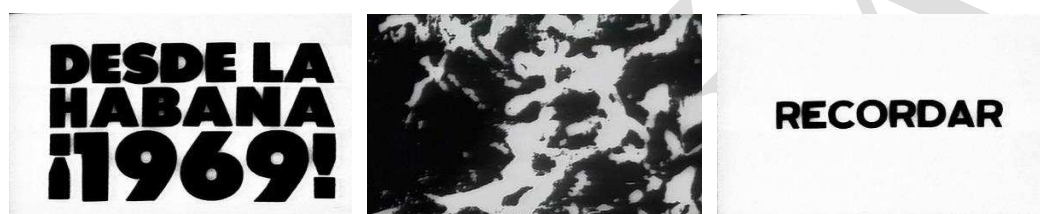
Figura 4. Escisión del título del film mediante al interpolación de imágenes de celuloide dañado

(fig. 4). En este caso, además, el recurso tiene una dimensión metafórica de gran intensidad especular, ya que apunta a una de las posibles interpretaciones del filme: el abuso de la historia y las limitaciones de la memoria en el marco de un periodo en el que se revisó capciosa y sistemáticamente el pasado en busca de un origen mítico legitimador del presente político 6 . Así, el intertítulo « Desde La Habana: ¡1969! », es seguido de un corte brusco a fotogramas en negro de celuloide dañado por un churre que salpica la pantalla y al que sucede un zoom de la palabra « Recordar » invadiendo el plano. Los signos de exclamación de la fecha subrayan la euforia (la histeria) de un periodo que hacía imposible una evocación ecuánime y distanciada de la historia. Por el contrario el pasado fue sometido por el castrismo a un reciclaje histriónico que el filme de Guillén Landrián hacía aún más caricaturesco al comprimir todo el devenir nacional a dieciocho escasos minutos.