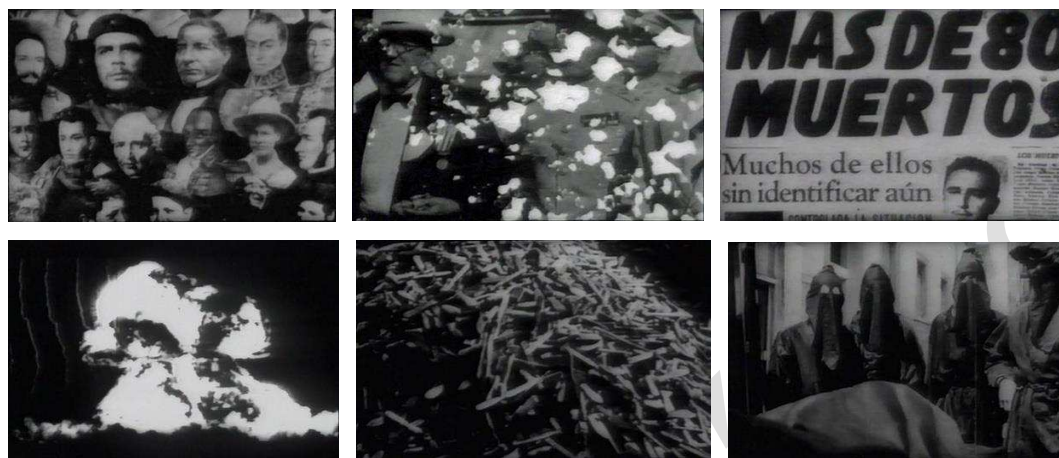
Figura 5. El devenir nacional/continental dentro de una visión apocalíptica de la Historia

los desafíos formales ensayados en Coffea Arábica , sugiriendo (quizá inconscientemente) el efecto opresivo de la propaganda en la existencia diaria.