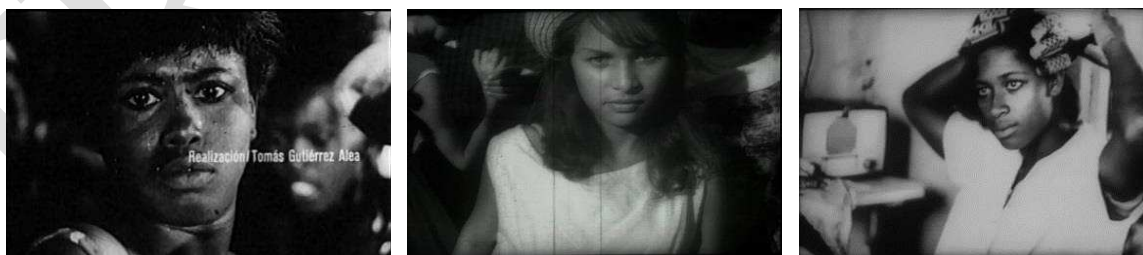
Figura 1. Metrajes reciclados en la obra de Guillén Landrián. A la izquierda, fotograma de la secuencia inicial no acreditada de Memorias del subdesarrollo (Tomás Gutiérrez Alea, 1968) incluida en Desde la Habana y planos procedentes de dos de sus filmes censurados: Reportaje (centro) y Retonar a Baracoa (derecha), ambos reutilizados en Coffea Arábica .

represión política y la marginación social fuera readmitido en un Instituto que en muchos momentos de su historia actuó como baluarte de la propaganda cultural del régimen.